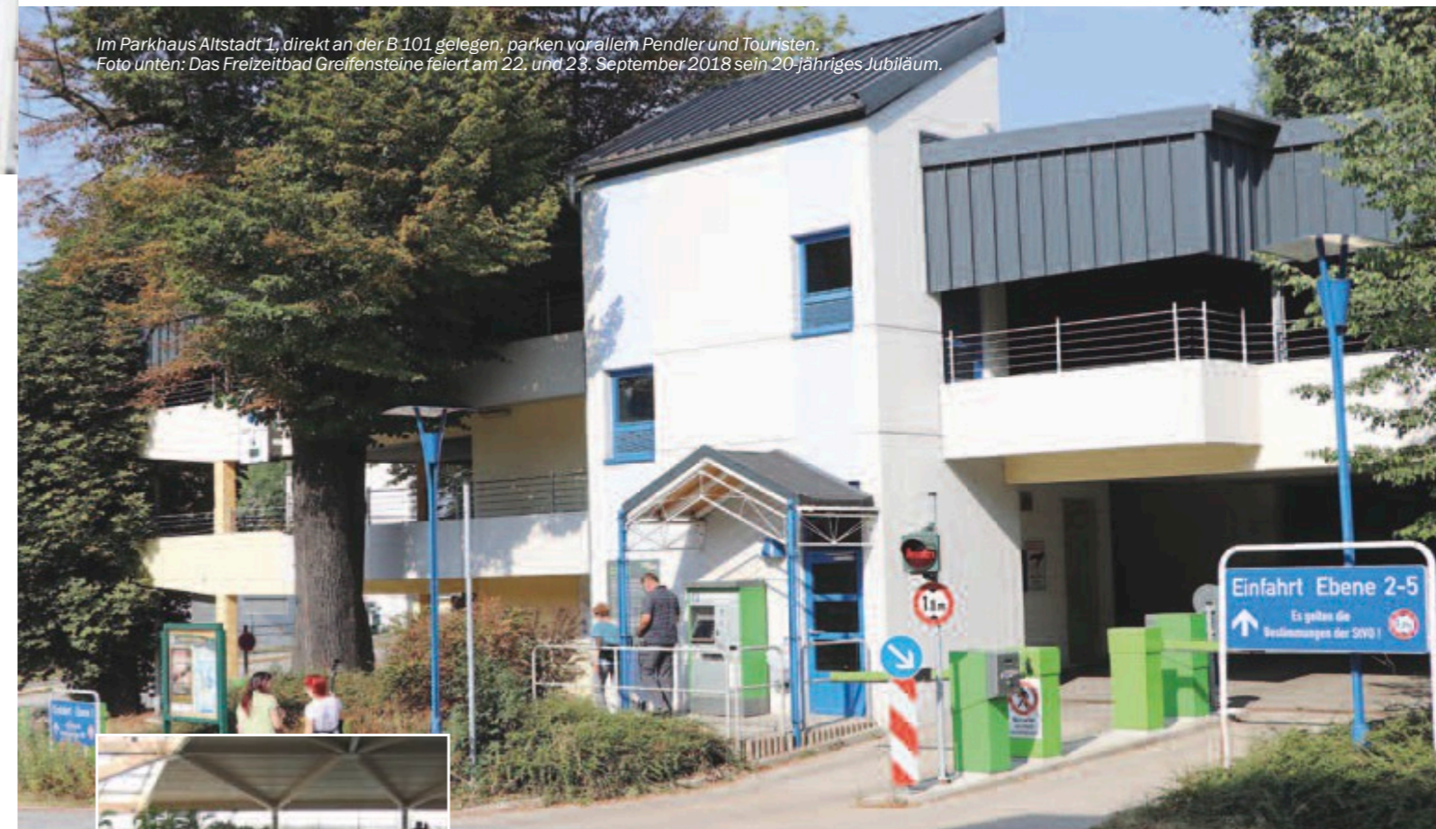
Im Parkhaus Altstadt 1, direkt an der B 101 gelegen, parken vor allem Pendler und Touristen. Foto unten: Das Freizeitbad Greifensteine feiert am 22. und 23. September 2018 sein 20-jähriges Jubiläum.

Wer als Tourist die Bergstadt erreicht, bekommt den Weg gewiesen. Mittels Parkleitsystem geht's zu einem freien Parkplatz.